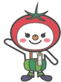
大阪市食育推進キャラクター 「たべやん」