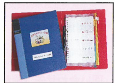
おまもりネット手帳【高齢者版】見本

詳しい内容の問い合わせ・申し込みは、各地域の 地域福祉活動サポーターまでご連絡ください。 連絡先は裏面に記載しています。